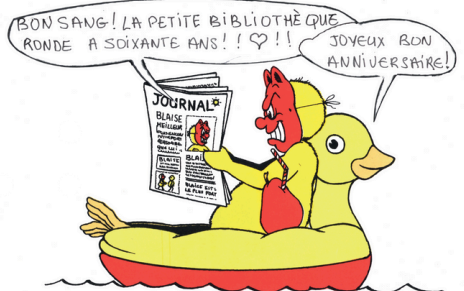
Illustration de Claude Ponti pour La Petite Bibliothèque Ronde

Quand les pratiques d'hier racontent celles d'aujourd'hui, nous évoquerons l'art et la manière de concevoir des projets qui mettent en lumière la littérature de jeunesse et ceux qui la font.