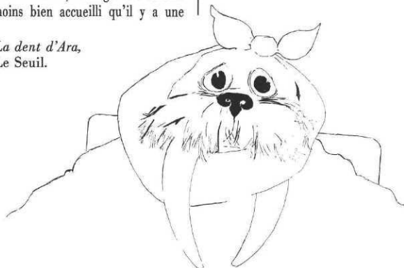
La dent d'Ara , Le Seuil.

quinzaine d'années... Les temps changent... Ça fait un défaut. Qui peut facilement s'arranger.