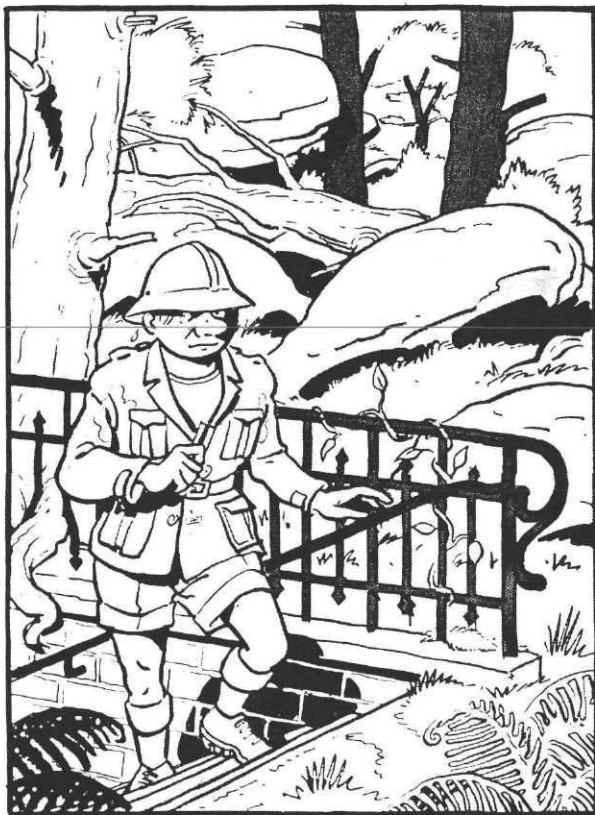
Luc Leroi par J.-C. Denis, Casterman.

L'événement c'est, bien sûr, La voyageuse de petite ceinture de Pierre Christin et Annie Goetzinger. C'est l'histoire de Naïma, une adolescente algérienne née en France, une beur. Elle choisit de vivre sur la voie désaffectée de la Petite Ceinture, sauvage ; de temps à autre elle a des rendez-vous avec le monde, et ça ne se passe pas très