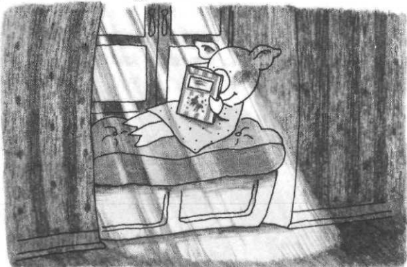
Poinsettia , Ecole des loisirs.

La collection Neuf s'étoffe ce coup-ci, après un démarrage timide. Elle couvre désormais un champ assez large: de neuf à treize ans, et s'adresse à des lecteurs très variés: