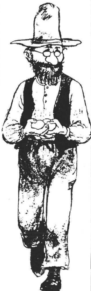
Le gâteau d'Auguste, Centurion jeunesse.