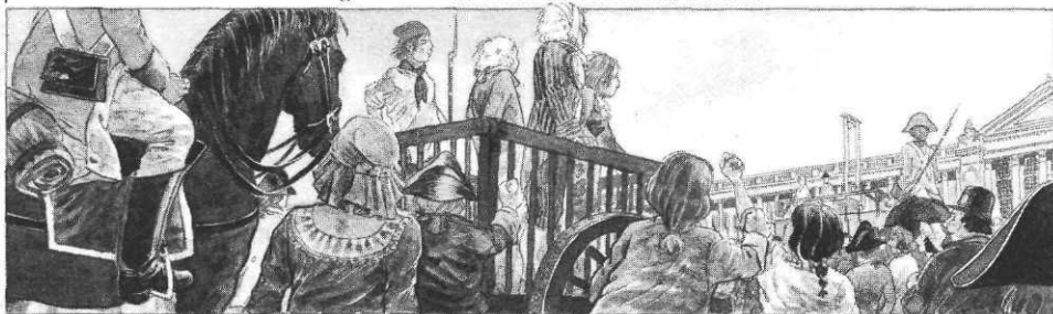
Le grand livre de l'Histoire de France, Nathan.