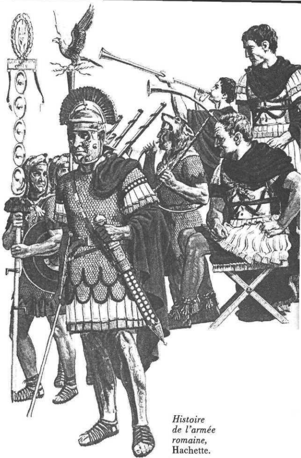
Histoire de l'armée romaine, Hachette.

Claude-Marie Vadrot : Voyage au cœur de la nature : parcs, réserves et espaces protégés, La France sauvage : plantes et animaux protégés. Deux livres qui se complètent. Celui sur la France sauvage présente surtout des animaux protégés. Mais il existe d'autres livres (celui du même auteur chez Atlas par exemple) réunissant une meilleure documentation photographique.