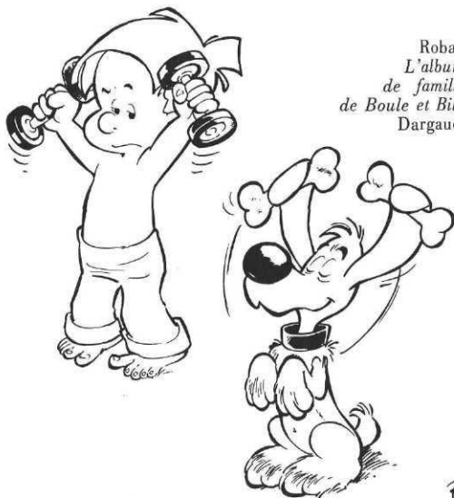
Roba : L'album de famille de Boule et Bill, Dargaud.

Roba : L'album de famille de Boule et Bill. Pour fêter son arrivée chez un nouvel éditeur, Roba rassemble ses meilleurs gags pleine page, agrémentés de commentaires sans prétention.