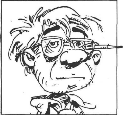
Bercovici par lui-même, Fleurus.

François Corteggiani, ill. Philippe Bercovici : Destination Duralex. Le héros est un robot aux inépuisables ressources. L'histoire mélange espionnage, science-fiction et parodie, tout en restant constamment amusante.