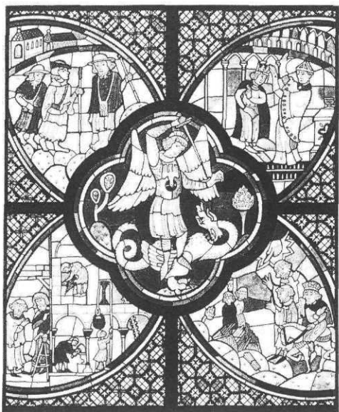
Le Moyen Age féodal, ill. Marie Thoisy, Epigones.

des origines de l'homme à la décolonisation, complété par un atlas et un long tableau synoptique. Une iconographie splendide pour une synthèse intelligente.