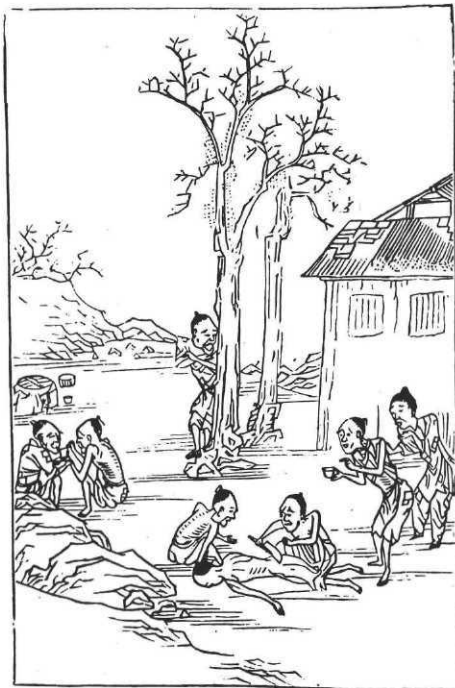
La faim, Farandole (famine en Chine).