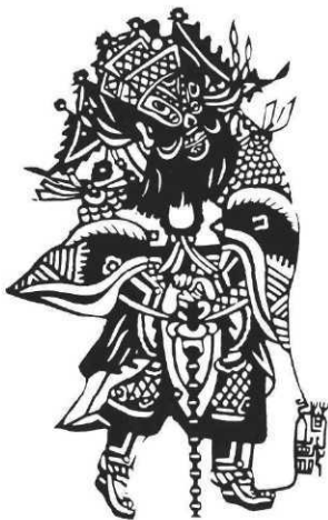
« Au pays des matins calmes. »