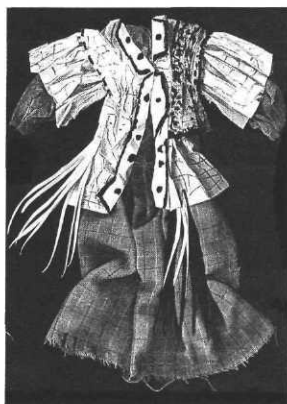
Costume pour Patarafe.