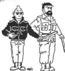
III. Hadès d'après Hergé, Bédésup n° spécial Tintin.