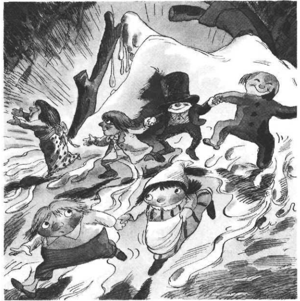
Hansel et Gretel , ill. Tony Ross, Kaléidoscope.

□ Chez Didier , une nouvelle publication du CREDIF : pour les tout petits, le deuxième volume des