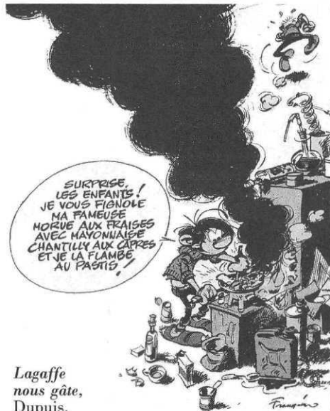
Lagaffe nous gâte, Dupuis.

Bruxelles, 15 juin 1989. Propos recueillis par Jean-Pierre Mercier et Nicolas Verry