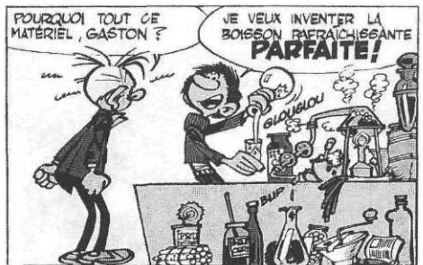
Le lourd passé de Lagaffe, Dupuis.

A.F. : C'est tentant, une bande collante. Je suis assez maladroit et nerveux, je ne fais pas souvent très attention et il y a des bandes collantes avec lesquelles je ne m'entends pas du tout. Il y a notamment cette cochonnerie de bande collante brune pour faire les cartons. C'est vraiment monstrueux.