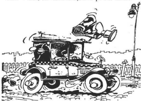
La voiture de Gaston Lagaffe.

A.F. : Oui, on commençait à parler sérieu-