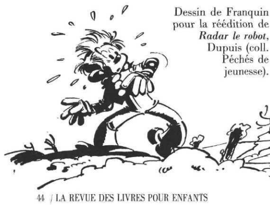
Dessin de Franquin pour la réédition de Radar le robot , Dupuis (coll. Péchés de jeunesse).

A.F. : J'ai ici des collections innombrables de « Science et Vie » ; quand je faisais Spi-