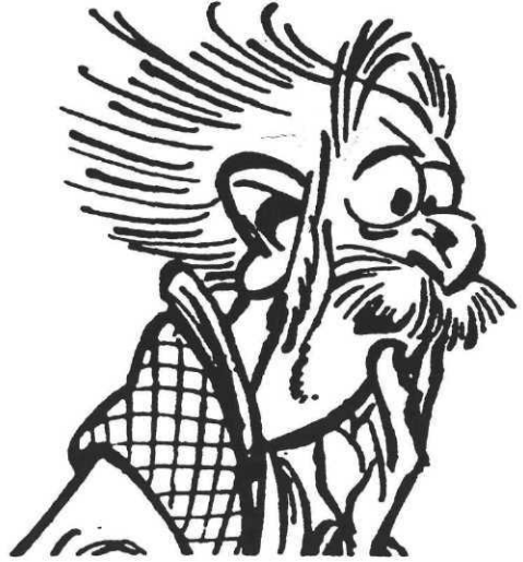
Le comte de Champignac.