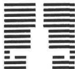
MAISON DU LIVRE DE L'IMAGE ET DU SON VILLE DE VILLEURBANNE

● Pour tout renseignement, Maison du Livre, tél. 78.68.04.04 et Mafpen de Lyon, 78.29.69.70, poste 121.