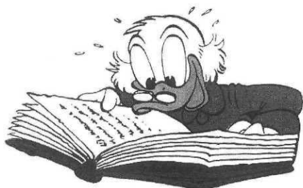
One'Picsou. Carl Barks, Zenda

Harold R. Foster : La quête du Graal et Le mur d'Hadrien . Suite de la réédition des aventures du preux chevalier. Un classique de la BD mondiale, qu'on découvre avec ses couleurs d'origine. Un régal pour l'œil.