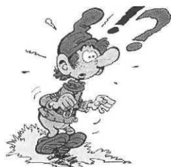
La forêt magique, Wasterlain, Dupuis