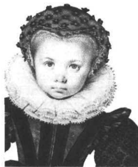
Fille à la pomme (détail). , Isaac Oliver, in : L'Art de voir , Casterman

■ Chez Casterman , L'Art de voir, pour comprendre l'art et créer soi-même , d'Anthéa Peppin et Helen Williams. Le sous-titre indique clairement la pertinence mais aussi l'ambition du projet et si la maquette peut donner l'illusion d'une clarté limpide (cinq parties, une double page par chapitre, des éléments d'introduction à l'histoire de l'art par la présentation des œuvres reproduites et les prolongements pédagogiques) le plan du livre peut, quant à lui, prêter à confusion et parfois paraître manquer de cohérence : pourquoi, par exemple dans la partie consacrée aux « lieux dans l'art » introduire à l'intérieur des chapitres traitant des différents sujets (endroits préférés, jardins peints) des chapitres sur les sys-