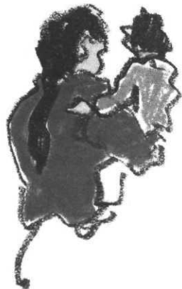
Sur la route de Fort Apache, ill. Jacques Caspar, Albin Michel Jeunesse

■ En coédition chez Gallimard-Larousse , D'un continent à l'autre est le sixième volume de la collection Découvertes junior consacrée à l'histoire mondiale et ici aux civilisations qui firent l'Europe du haut Moyen Âge, des Vikings aux Mongols en passant par les royaumes musulmans. La riche iconographie est le