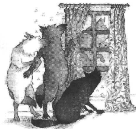
Les Trois Petits Loups et le Grand Méchant Cochon, ill. H. Oxenbury, Bayard Editions