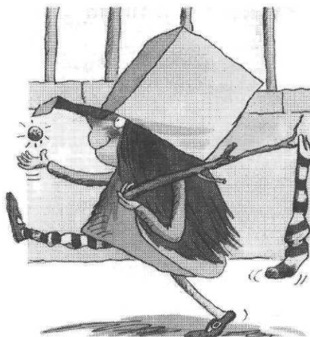
La Chaussette aux trésors, ill. T. Ross, Épigones