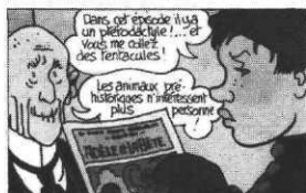
Tous des monstres, ill. Tardi, Casterman

■ Peu de choses à signaler chez Dargaud , si ce n'est le 7e tome du Moine fou de Vink. Les Tourbillons de fleurs blanches (53 F), qui voit He Pao, la guerrière à la recherche du moine fou, aborder la Chine sous la neige. Le travail de graphiste de Vink est impressionnant, son talent de narrateur tout autant. Les adolescents férus d'histoire et d'exotisme devraient aimer ce tome, comme les précédents.