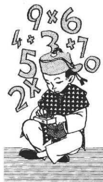
Le Mystère Hans Arp. Verger-éditeur

plusieurs mois de lectures, de découvertes d'objets, de rencontres et de fêtes, les enfants ont écrit pour faire écho à la parole qu'ils ont écoutée et laissé résonner en eux. Leurs voix, leurs dessins interrogent : comment peut-on être Indien, comment regarder, entendre, sentir évoquent un ailleurs tantôt mythique, tantôt tout proche, devenu patiemment un peu plus accessible.