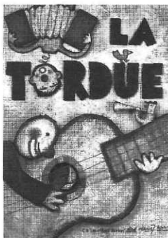
Pochette de CD pour le groupe La Tordue, éditions Delabel, dist. Média 7.

C.A.P. : Est-ce que l'emploi du volume ne vous enferme pas dans un style qui conditionne les sujets que vous traitez ?