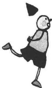
Jouons avec les lettres, Massin, Les Chats pelés, Seuil Jeunesse

I ls sont trois, trois copains graphistes, qui se sont donné un drôle de nom, Les Chats pelés et ont fait une entrée remarquée dans le domaine du livre pour enfants en co-signant avec Massin les deux albums parus au Seuil Jeunesse en 1993, Jouons avec les lettres et Jouons avec les chiffres .