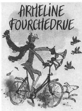
ill. de Q. Blake, Gallimard L'un des lauréats des Prix Versele 1995