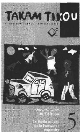
Takam Tikou n°5. Le Bulletin de La Joie par les livres