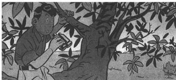
La Danse du Poko, ill. O. Wozniak, Dupuis

avec nuance du thème du colonialisme et de la violence, au temps où le Congo était encore une colonie belge.