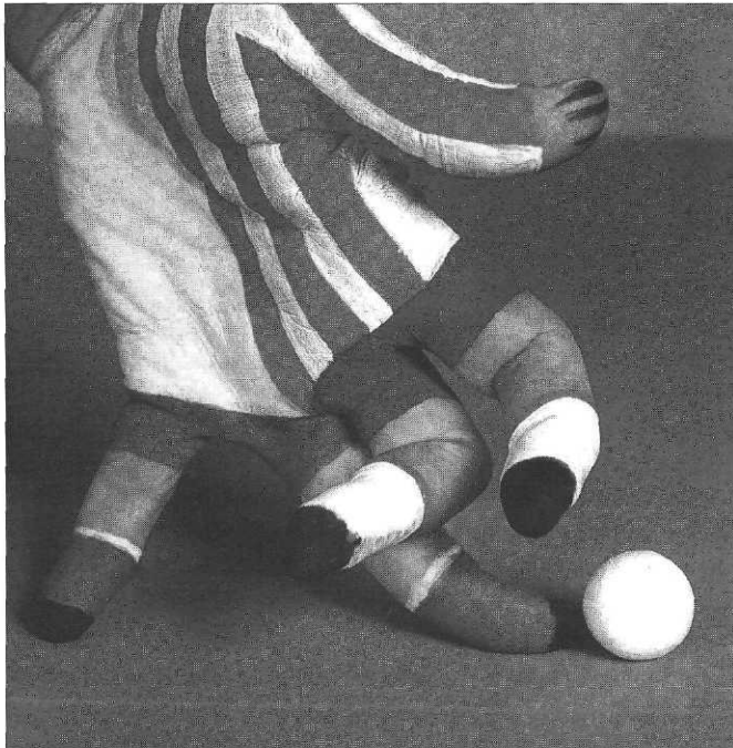
Faute de main , Mario Mariotti, Circonflexe

Dans un autre livre Dall'altra parte del libro , (Nuova italia Editrice, 1982) Mariotti utilise la photo dans un but de réflexion et de rapprochement sur des modes de vie d'enfants apparemment sans rapport : une petite ville en Italie, un village d'Afrique du nord. Il joue alors sur un basculement du livre qui se lit dans les deux sens tenant compte du sens inverse des écritures latine et arabe. Ses photos « documentaires » prennent leur valeur artistique dans le livre lui-même et sa maquette simple mais réfléchie.