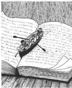
ill. O. Sibertin-Blanc L'École des lettres des collèges , juin 1996.

Quel CDI voulez-vous ? Une vaste question soulevée par le numéro spécial de L'École des lettres des collèges , 15 juin 1996. Le CDI, entre lieu d'accueil et lieu d'apprentissage, ne trouve pas toujours sa place dans les projets d'établissement et le documentaliste, outre une légitimité professionnelle pas toujours bien perçue, se trouve souvent bien seul. Une enquête montre en effet les limites de la collaboration entre documentaliste et professeurs. On trouve aussi dans ce numéro des pistes sur les recherches documentaires avec des livres de fiction, une réflexion sur la place de la télévision, l'informatique et les nouvelles technologies, le tout au CDI.