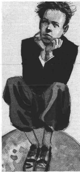
ill Gibrat in Phosphore , n°184, 1996

Autre centenaire, celui de l'Affaire Dreyfus, une affaire compliquée,