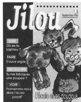
Jilou , le nouveau titre des PEMF

Depuis septembre, avec Jilou , le nouveau titre destiné aux petits de 3/4 ans, les Éditions PEMF ont un titre pour chaque étape scolaire, de la maternelle au lycée. Jilou comporte quatre séances : dire, avec un récit presque tout en images pour que l'enfant raconte sa propre histoire à travers des mises en scène de la vie quotidienne ; faire ; découvrir et comprendre ; et enfin voir. Le n°1 aborde les « doudous » que l'enfant emmène à l'école, le n°2, octobre 1996, s'intéresse aux escargots. Était-il bien nécessaire que les PEMF proposent un nouveau magazine pour les jeunes enfants, le créneau étant déjà largement et