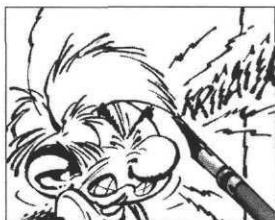
ill. Seron, in Spirou , n°3058

Avis aux petits Mickey, le n°3058 de Spirou du 20 novembre 1996, a un supplément de 64 pages consacré à la fabrication d'une bande dessinée. 84 auteurs, scénaristes et dessinateurs, donnent leurs trucs pour imaginer et dessiner une histoire. Étape par étape, tout est étudié, des personnages au décor, en passant par la documentation, la mise en couleurs et l'impression, jusqu'à la promotion du titre. Un numéro qui donne irrésistiblement envie de faire sa propre BD, en vrai professionnel !