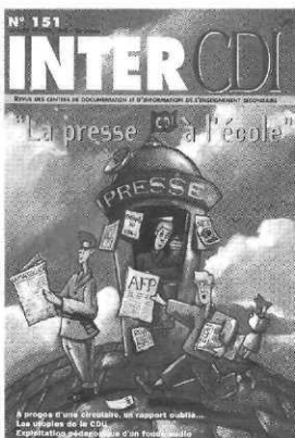
La Presse à l'école in Inter-CDI , n°151