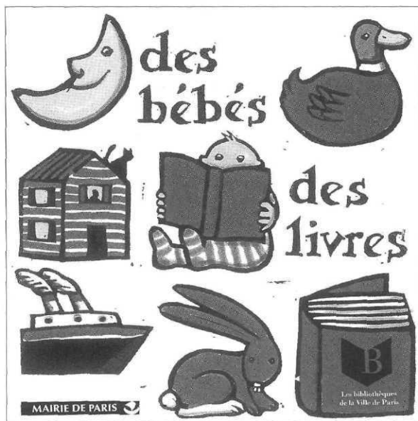
Des bébés et des livres, Agence culturelle de la Ville de Paris

• Renseignements : Médiathèque départementale, rue J.B. Colbert - 77350 Le Mée-sur-Seine. Tél. 01 60 56 95 00 - Fax 01 60 56 95 10