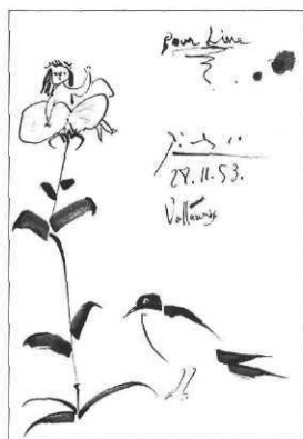
Lettre de Picasso à Jacqueline Duhême in Passions Couleurs , Gallimard Jeunesse-Seuil

Une nouvelle exposition sera réalisée en septembre 1998 : « Sous la mousse, les Tom Pouce »... qui rassemblera des histoires du Petit Peuple (elfes, lutins, trolls...) et comprendra 14 tapis et environ 70 personnages. Éric Hammam, conteur, propose des animations raconte-tapis d'une heure et demie.