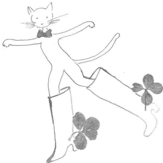
Quadrifogli , ill. C. Rossati