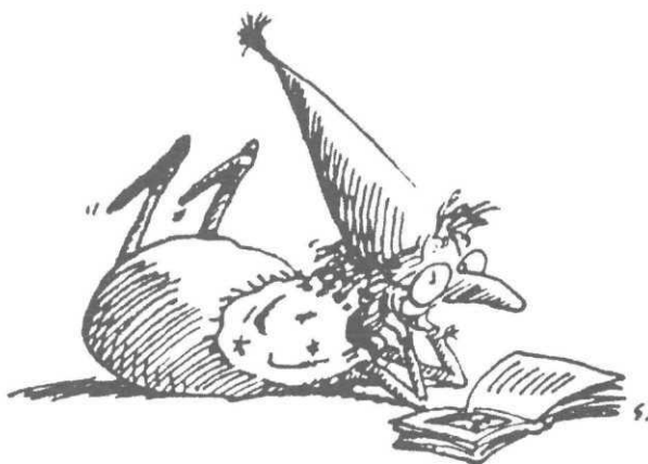
Le 2 ème logo de l'ALSJ, ill. S. Bloch