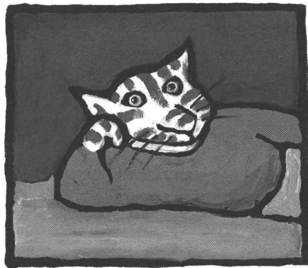
Un Chat est un chat, ill. G. Solotareff, L'École des loisirs

À l'initiative du Théâtre du Tilleul, une semaine de manifestations autour de Grégoire Solotareff s'est tenue du 25 au 30 octobre 2002 à la Montagne magique à Bruxelles.