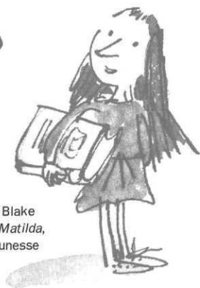
ill. Quentin Blake extraites de Matilda , Galimard Jeunesse

Le point de vue d'une passionnée des livres et des bibliothèques : changer, oui, mais sans oublier le principal !