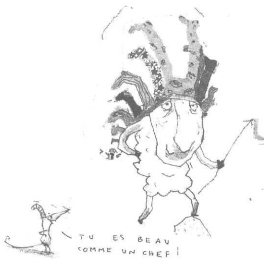
ill. H. Riff, in Aeiou , n°2 février 2003

historique des bibliothèques les « Heures Joyeuses » de la ville de Bruxelles entre 1920 et 1978.