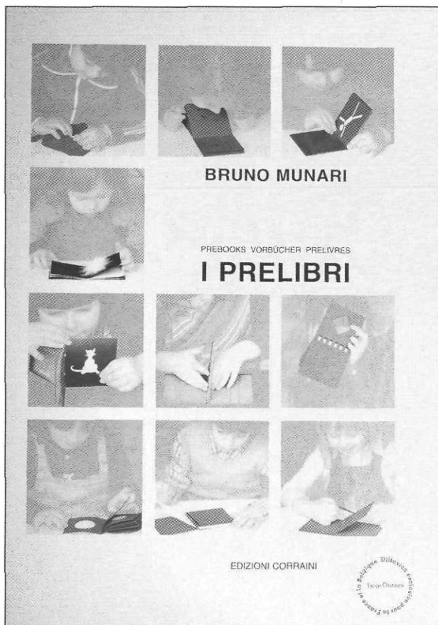
Les Pré-livres de Munari, éditions Corraini, diffusés en France par Les Trois Ourses