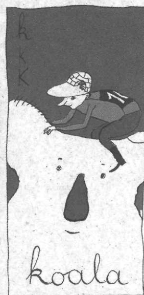
a, b, c, d, euh... Jean-Vincent Sénac