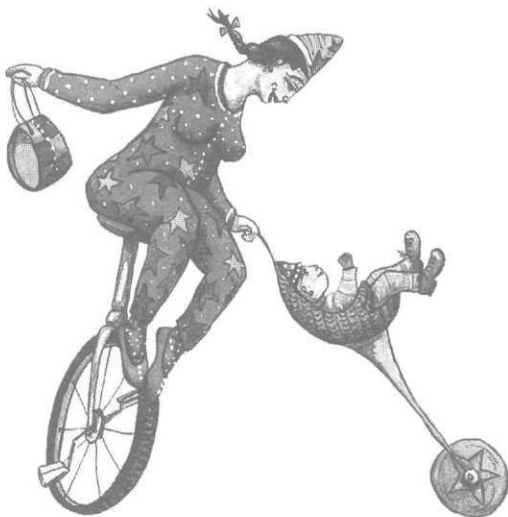
Mères belles, Valérie Dumas