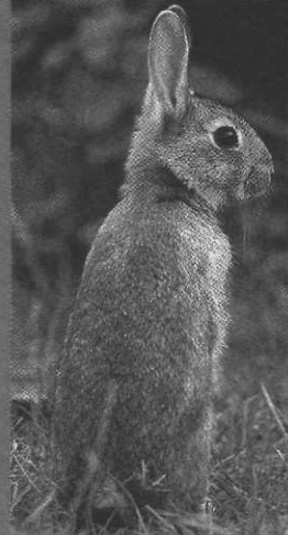
Le Lapin, lutin des prés, Milan