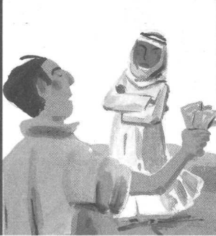
Le Cadeau du désert, ill. C. Le Grand, Milan