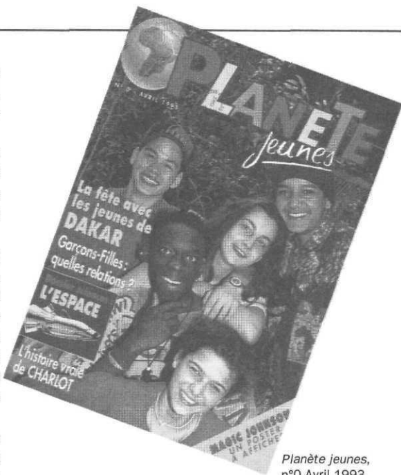
Planète jeunes, n°0 Avril 1993

Efforts pour trouver et former des créatifs, là où l'édition et la presse jeunesse sont si peu développés. Pour créer une petite équipe qui assure le contrôle des ventes en kiosque et à travers les écoles dans 25 pays... Pour relancer année après année les réseaux de distribution que les guerres ou les errances économiques détruisaient.