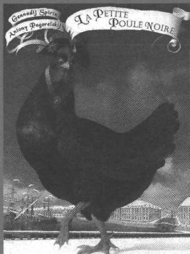
La Petite poule noire, ill. G. Spirin, Albin Michel Jeunesse