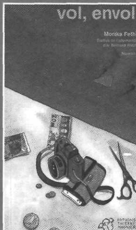
Vol, envol, ill. A. Guilloppé, Thierry Magnier