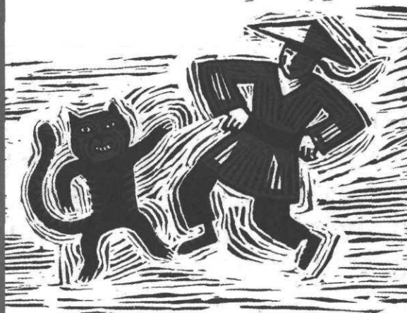
Le Chat-Tigre : conte yao de Chine, ill. R. Saillard, Syros Jeunesse