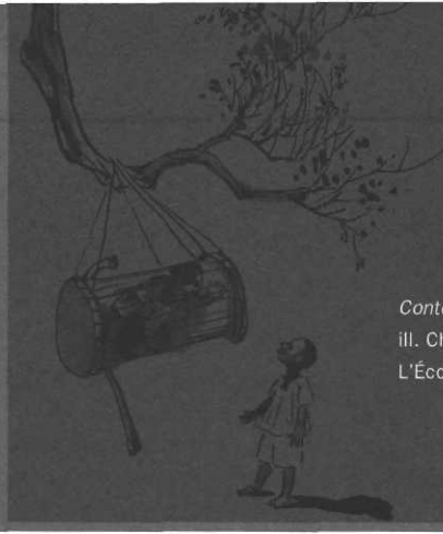
Contes sànan du Burkina Faso, ill. Chen Jiang Hong, L'École des loisirs

les messages d'une autre culture dont elle connaît les codes. C'est l'idéal car c'est si malin que l'on se sent à peine étranger. C'est parfaitement lisible à haute voix. Un très beau recueil dans lequel on trouve une « fille caillou » protégée par un fromager devenu sa mère adoptive, un père trop autoritaire meurtrier de son fils, une fille née sans seins et qui a bien du mal à en trouver qui tiennent bon... Des histoires à dormir debout (?) qui parlent d'amour, de maternité, de haine, de la famille, de tout ce qui nous intéresse tant dès notre plus jeune âge. (E.C.)