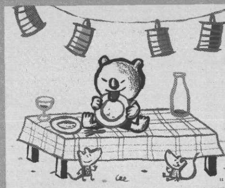
Rimes et chansons des p'tits loupis, ill. D. Cauquetoux, Didier Jeunesse

lele » chantés par des gens du cru, adultes et enfants accompagnés par des instruments typiques : guitare à douze cordes, cavaquinho ou bandolim. Inséparable du CD, l'album propose les paroles en langue originale, leur traduction et des indications sur chaque titre. Pour tout public, lusophone ou non.