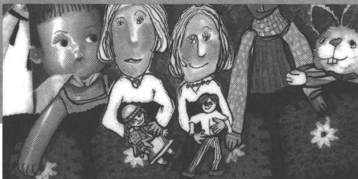
Chansons à dormir couché,