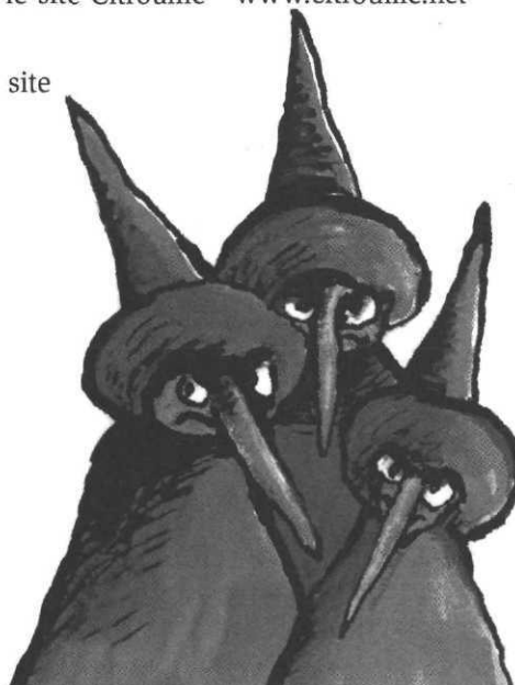
Trois sorcières, ill. G. Solotareff, L'École des loisirs