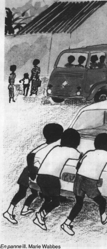
En panne ill. Marie Wabbes

Jeanne de Cavally ; ill. Martine Cogne.- Abidjan, Dakar, Lomé : NEA, 1987.- 31 p. : ill.coul. ; 26 x 19 cm. ISBN 2-7236-1424-7 : 31 FF.