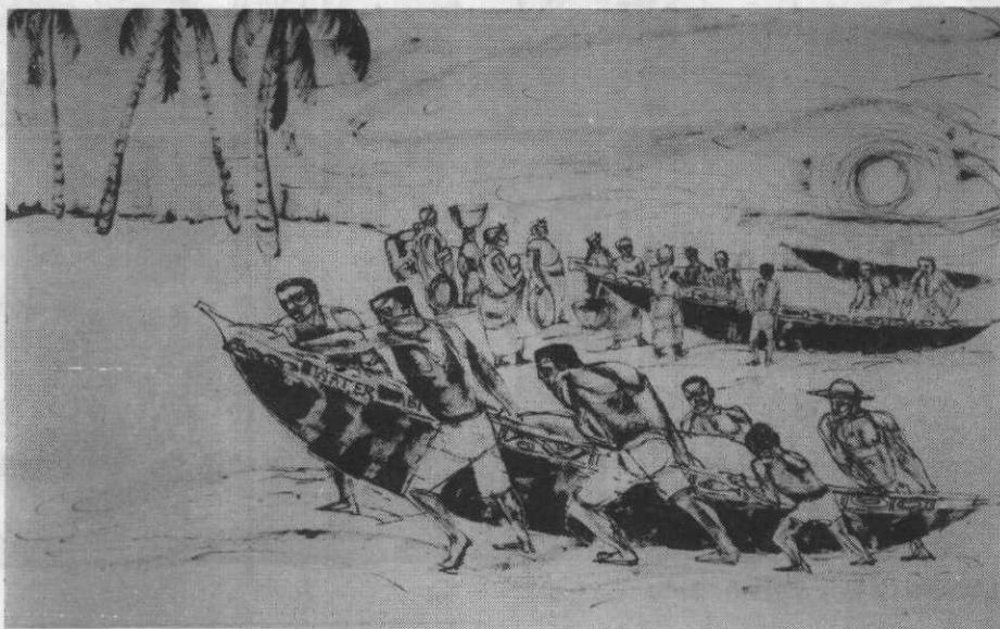
Tawia va en mer ill. Meshack Asare

Abidjan, Dakar, Lomé : NEA, 1985.- [24 p.] : ill. ; 27 x 21 cm.- ISBN 2-7236-0735-6 : 24 FF. Diff. en France Larousse/Nathan International