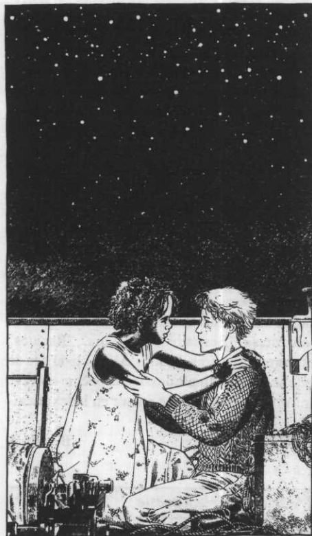
Les clandestins ill. Philippe Munch

Bien que conscient et solidaire de la révolte des siens, il refuse de s'engager tant que ses études ne sont pas finies. Mais la violence s'impose à lui. Un jour d'émeute, il se trouve face aux forces de l'ordre, et à Frikkie l'arme à la main. Deux communautés, deux univers inconciliables qui s'affrontent dans un dramatique face à face. Un livre fort.