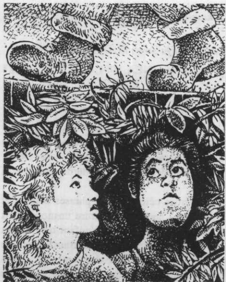
Les enfants de la cité ill. François Gervais