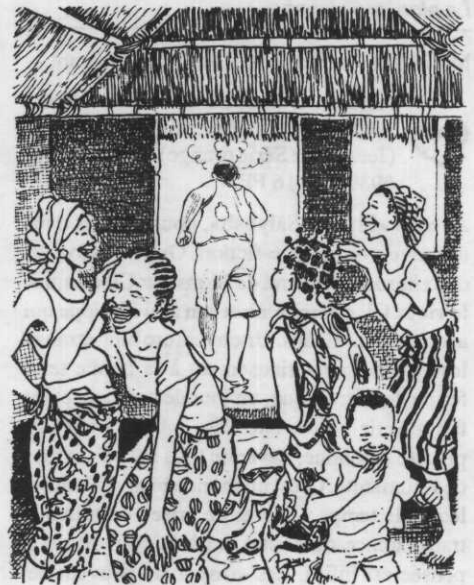
Un enfant comme les autres