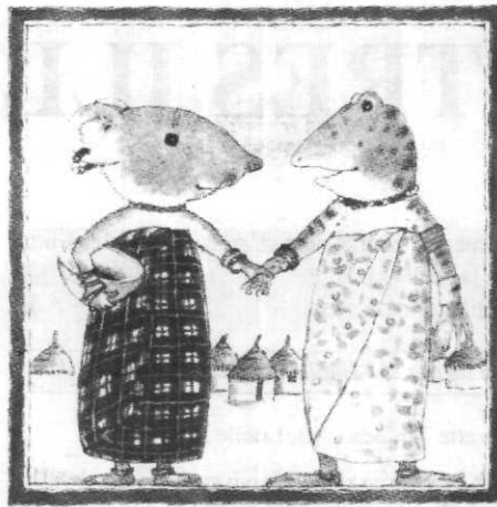
La souris et la grenouille ill. Lucile Butel

Un récit simple, un conte à la morale et aux vertus éducatives explicites tout en étant divertissant : c'est ce que souhaite l'auteur au début de ce petit album. Celui-ci illustre la reconnaissance que l'on doit à celui qui vous a aidé : «Si