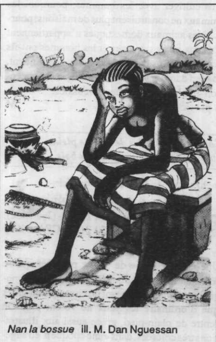
Nan la bossue ill. M. Dan Nguessan

Sept anecdotes où s'illustre, sous la forme d'un dialogue de théâtre, la ruse proverbiale de Bakamé le lièvre, face à Mapizi l'hyène, au lion, à la panthère. Un texte réduit à l'essentiel mais qui suffit, aidé par une illustration pleine d'humour, à rendre la saveur de ces épisodes cocasses.