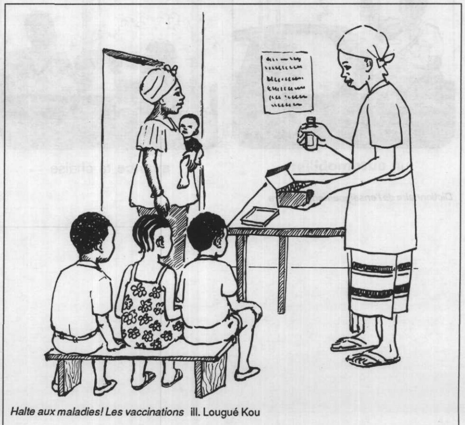
Halte aux maladies! Les vaccinations ill. Lougué Kou