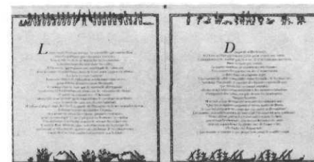
Le stratagème de Dargouth, ill. Bruno Fourure

Tunis : Alif : Paris : Syros/Alternatives, 1988.- [29 p.] : ill. coul.; 25 x 25 cm.- (Une aventure d'un corsaire barbaresque en Méditerranée). ISBN 9913-716-05-1/ ISBN 2 86738 306-4 : 80FF.