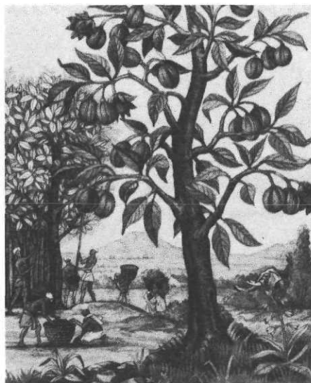
1492 en Méditerranée, ill. Isabelle Courmont

Tunis : Paris : Alif, les éditions de la Méditerranée : Hatier, 1992.- [16 p.] : ill. coul.; 25 x 25 cm.- ISBN 2-218-04892-2 : 120 FF.