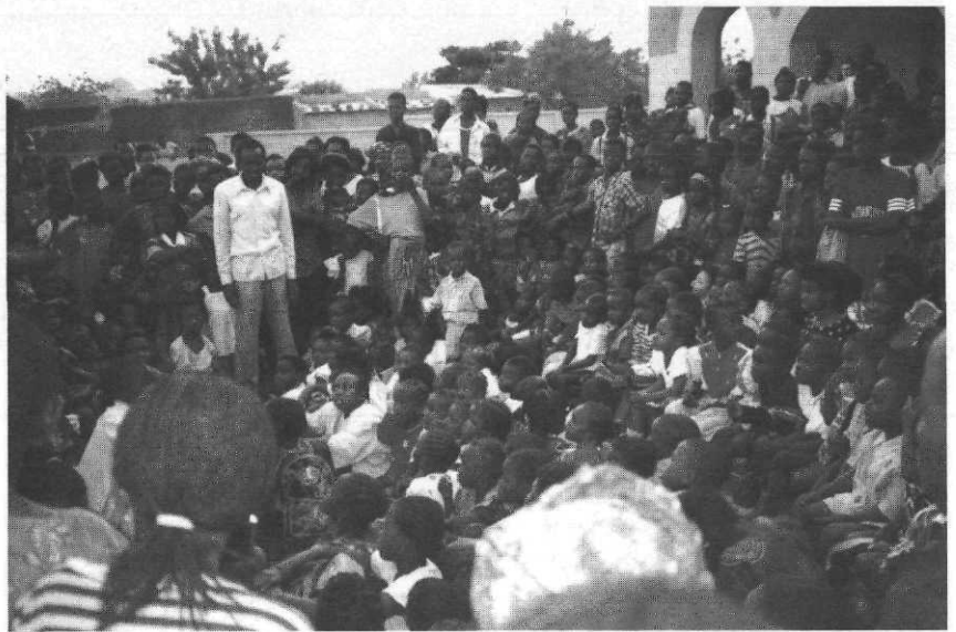
Une séance « contes » à l'extérieur du CLAEC.

Aménagement urbain, politique d'assainissement, santé, culture... Angers consacre, depuis 1985, 0,5 % de son budget municipal d'investissement à des réalisations au Mali. L'action en faveur de l'enfance et de l'éducation est une des priorités: dans chacune des six com-