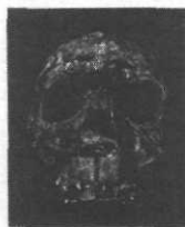
Les voyages d'Homo erectus

A.M. BACON. Rouge et or (Explorons), 1992. 85 F. 12 ans. Les traces fossiles de nos ancêtres se trouvent en Afrique. Ce documentaire illustré explique les différentes étapes, depuis l'apparition de la vie jusqu'aux hommes de Cro-magnon.