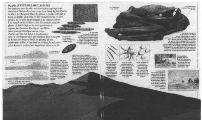
La vie des déserts

Avec de nombreuses photos couleur, formation, classification et exploitation des minéraux et pierres précieuses.