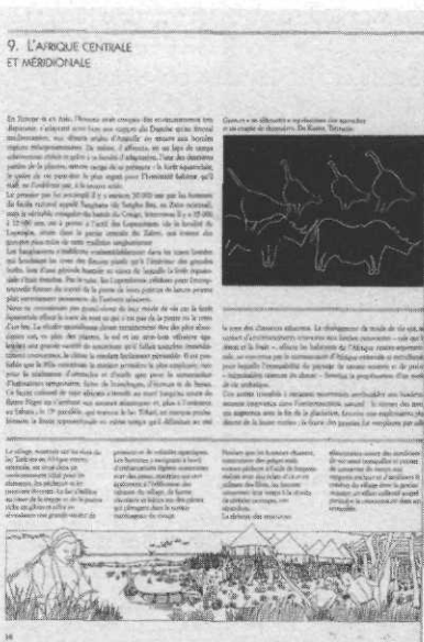
Premiers villages, premières cultures, la révolution du néolithique

Le commerce de l'ivoire remonte à l'antiquité. Son histoire permet de prendre conscience des enjeux politiques actuels et de la nécessité de son interdiction.