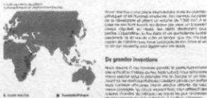
Les origines de l'homme