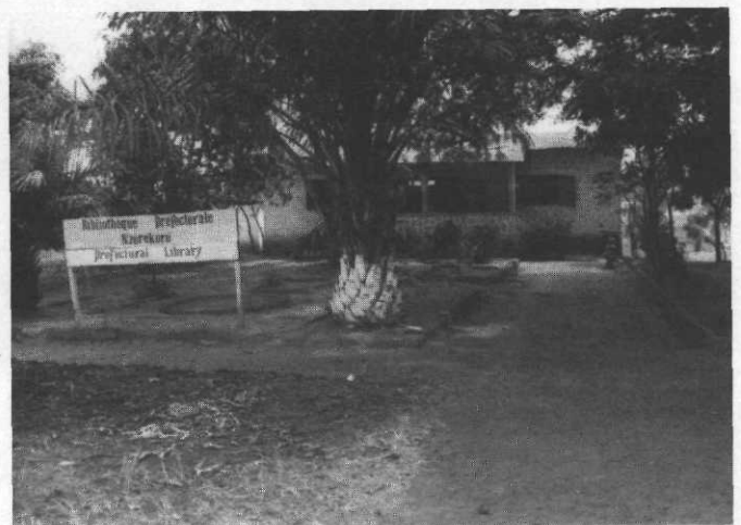
Le bâtiment de la bibliothèque.

La bibliothèque est située en plein centre-ville à côté des services administratifs aux alentours de la Place des Martyrs, face aux bureaux de la Préfecture du côté est, et reste la seule institution de lecture publique de la ville. Cependant il y a, à côté, une salle de documentation du Centre de Perfectionnement Linguistique (CPL), deux petites bibliothèques spécialisées, l'une à l'Inspection