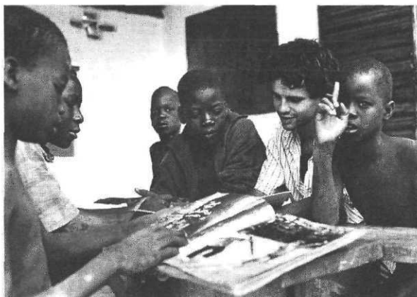
La Cour aux cent métiers.

Gallimard (La bibliothèque du voyageur), 1995. 175 F. Cette collection s'attache particulièrement à l'histoire et à la société. De ce fait, ce n'est pas seulement un guide de voyage (informations pratiques) mais un ouvrage de référence. Nombreuses cartes et illustrations en couleur. Présentation des différentes régions par itinéraires.