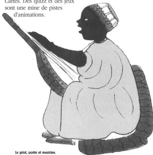
Le griot, poète et musicien.

Images Doc comporte plusieurs rubriques : images d'animaux, d'histoire, de sciences et du monde. Une mise en page très variée: illustration pleine page comme le campement des femmes de la tribu Afar; zoom sur un détail. Cartes. Des quizz et des jeux sont une mine de pistes d'animations.