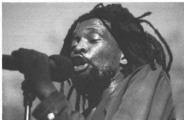
Afro ! les musiques africaines

Discographie des enregistrements traditionnels. Glossaire de termes musicaux et liste des festivals.