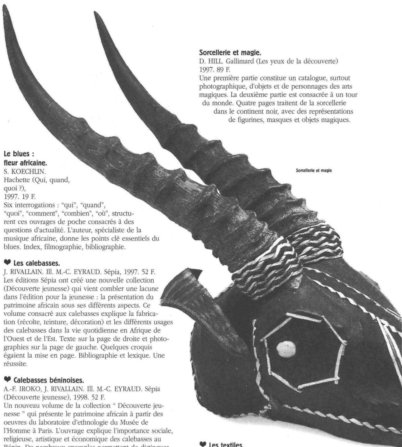
Sorcellerie et magie