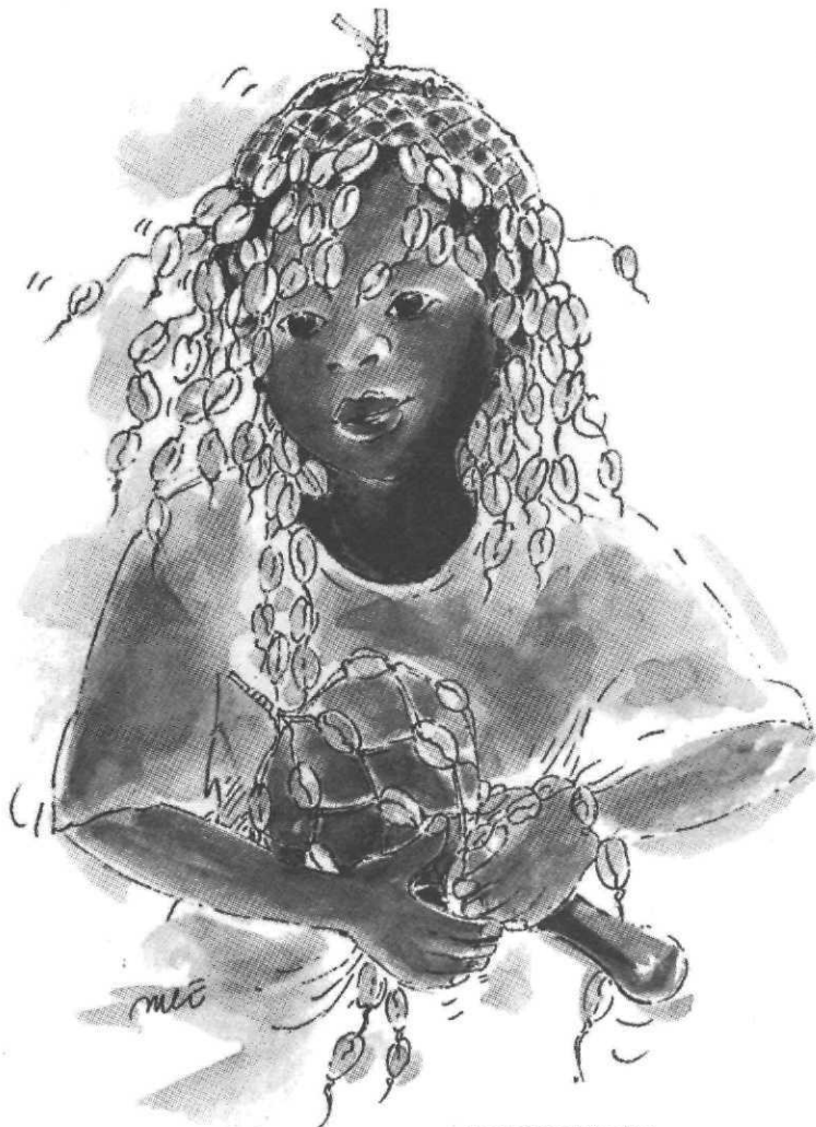
Les Calebasses béninoises

Conformément à l'esprit de cette collection, un auteur est confronté à des œuvres d'art, ici des masques africains. Une confrontation qui donne lieu à un texte – une rêverie – littéraire pas toujours en rapport direct avec les œuvres représentées. Dans ce volume, les masques sont mis en vis-à-vis avec une anecdote