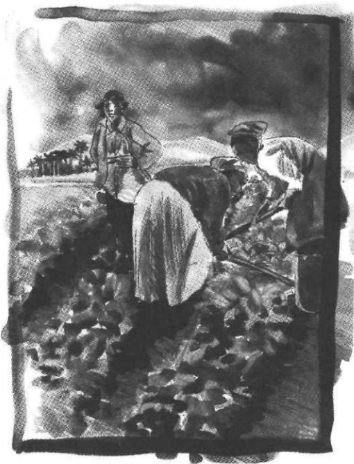
J'étais enfant en Algérie : juin 1962

"Le baiser" qui prête son titre au recueil de nouvelles de Leïla Sebbar consigne la thématique de l'ouvrage :