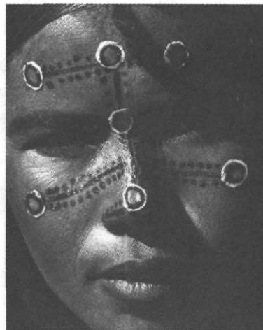
Paroles de touaregs