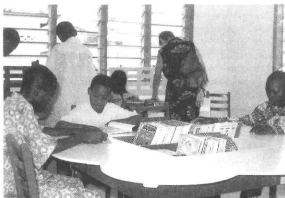
Centre d'étude et de documentation, Cotonou-Akpakpa.